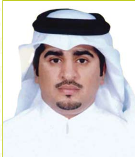
سعادة السيد عبد الله بن خالد القحطاني

سعادته وزير الصحة العامة والأمين العام للمجلس الأعلى للصحة منذ ٢٨ أبريل ٢٠٠٩ حتى الوقت الحالي. وقد شغل سعادته أدواراً مرموقة مثل وكيل وزارة الاقتصاد والتجارة، رئيس مجلس إدارة اللجنة المنظمة للألعاب الآسيوية (آسياد)، نائب رئيس مجلس الإدارة لشركة حصاد. نائب رئيس لجنة المناقصة، عضو مجلس إدارة المجلس الأعلى للشؤون الاقتصادية والاستثمارية، عضو مجلس إدارة مصرف قطر المركزي، رئيس مجلس الإدارة وعضو مجلس إدارة مهرجان قطر البحري، وعضو مجلس إدارة الهيئة الوطنية للصحة. سعادته رئيس لجنة المحاسبين القانونيين. سعادته أيضاً رئيس وعضو مجلس إدارة شركة الإستثمارات القطرية الرياضية (QSI).