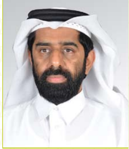
سعادة الدكتور صالح محمد النائب